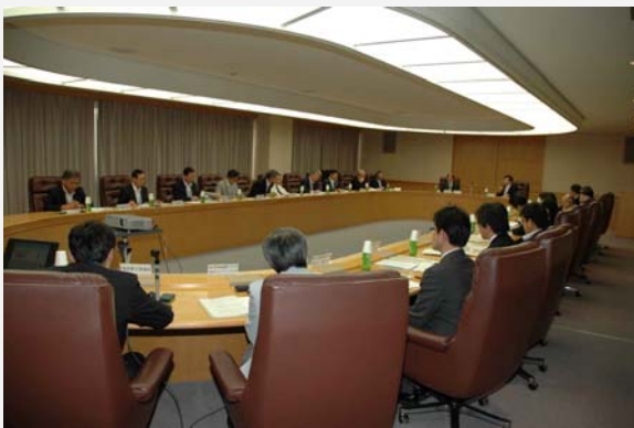
福井高専地域連携アカデミア総会の様子

6月24日、福井商工会議所において平成25年度「福井高専地域連携アカデミア総会」を開催しました。地域連携アカデミアは、福井県内の企業が会員となり、福井高専の教育研究に対する協力や助成事業を行っているもので、今年度の総会には会員、関係機関及び本校教職員29名が出席しました。