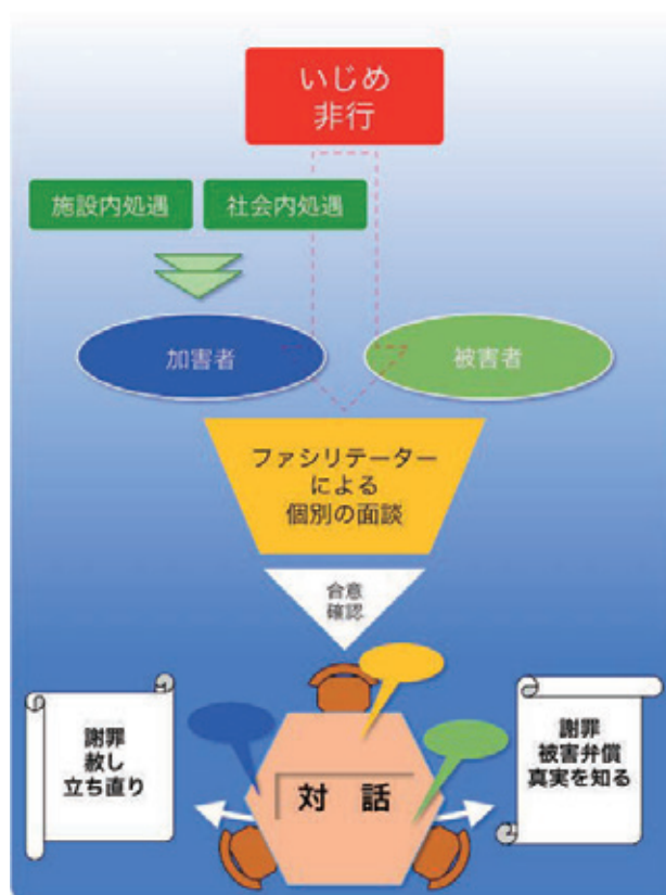
図1 対話による解決のアプローチフロー図

日本で実施した場合の効果について検証するとともに、教育現場で生じる問題の1つである「いじめ」や「非行」といった諸問題への応用と実践が研究課題です。