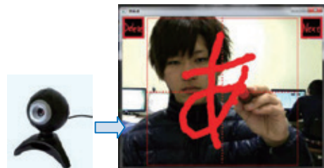
図2 画像処理を用いた文字認識

画像処理と最適解探索を用いて、画像上の特定物体(顔, 手指, 文字など)を検出しています。また、パターン認識により、検出物体の分類にも取り組んでいます(図2)。さらに、動画像処理により、動作認識を用いたインターフェース開発も試みています。