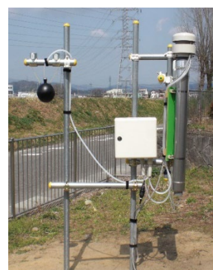
図1 定点観測型WBGT自動測定システム

福井県では実測されていない黒球温度を本校で測定し、併せて湿球温度、乾球温度を測定することで、本校における正確なWBGT（暑さ指数）を求め、学生・教職員および地域住民の熱中症予防に寄与することを目的に現在活動中です。