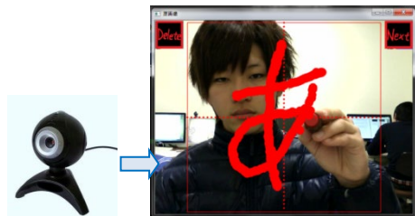
図2 画像処理を用いた文字認識

画像処理と最適解探索を用いて、画像上の特定物体(顔, 手指, 文字など)を検出しています。また、パターン認識により、検出物体の分類にも取り組んでいます(図2)。さらに、動画像処理により、動作認識を用いたインターフェース開発も試みています。