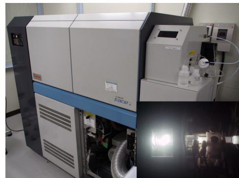
図2 高分解能 ICP-MS 装置による微量元素の分析