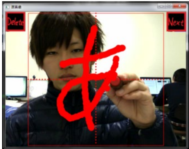
画像処理を用いた文字認識