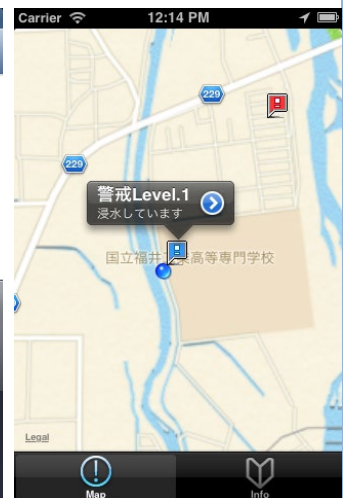
住民閲覧時の画面