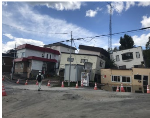
写真1 傾斜した家屋(液状化)

今後起こりうる様々な災害から人々の暮らしを守るための社会基盤づくりを, 福井県を対象として行います。地域防災力の向上を目的とし, 現地調査・アンケート調査・避難シミュレーション等を地域住民のみなさんの意見を取り入れながら進めていきます。