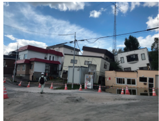
写真1 傾斜した家屋(液状化)

今後起こりうる様々な災害から人々の暮らしを守るための社会基盤づくりを, 福井県を対象として行います。地域防災力の向上を目的とし, 現地調査・アンケート調査・避難シミュレーション等を地域住民のみなさんの意見を取り入れながら進めていきます。