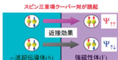
図.1 超伝導/強磁性接合において、近接効果によって出現するスピン三重項クーパ対の概念図

研究成果の一例として、図2 の左側に示した、超伝導体、強磁性体そして常磁性体の多重接合で、近接効果によって常伝導体中に誘起されるスピン三重項クーパ対のスピンを調べました。その結果、スピン三重項クーパ対のスピンに起因した磁化が、常伝導体に誘起されることを明らかにしました(図 2 の右側)。この磁化の特徴は、超伝導体間の位相差( \theta )によって制御することができます。 \theta を変えることによって、磁化の大きさが変わるので、この磁化の変化を実験的に観測できれば、スピン三重項クーパ対の存在を直接確認することができます。今後は、応用への可能性も視野に入れて研究を行う予定です。