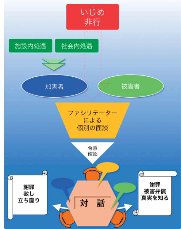
図1 対話による解決のアプローチフロー図

日本で実施した場合の効果について検証するとともに、教育現場で生じる問題の1つである「いじめ」や「非行」といった諸問題への応用と実践が研究課題です。