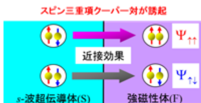
図.1 超伝導/強磁性接合において、近接効果によって出現するスピン三重項クーパー対の概念図

研究成果の一例として、図.2 の左側に示した、超伝導体、強磁性体そして常磁性体の多重接合で、近接効果によって常伝導体中に誘起されるスピン三重項クーパー対のスピンを調べました。その結果、スピン三重項クーパー対のスピンに起因した磁化が、常伝導体に誘起されることを明らかにしました(図 2 の右側)。この磁化の特徴は、超伝導体間の位相差( \theta )によって制御することができます。 \theta を変えることによって、磁化の大きさが変わるので、この磁化の変化を実験的に観測できれば、スピン三重項クーパー対の存在を直接確認することができます。今後は、応用への可能性も視野に入れて研究を行う予定です。