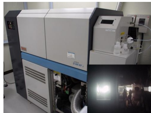
図2 高分解能 ICP-MS 装置による微量元素の分析